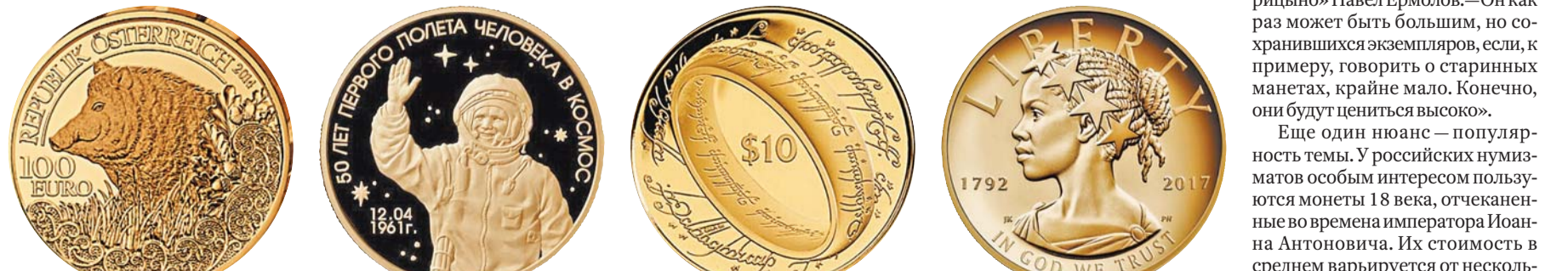
Слева направо: «Дикий вепрь», «50 лет первого полета человека в космос», «Властелин колец» и так называемая «Черная Свобода».